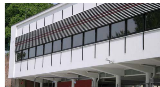
Adeguamento spogliatoi per uso invernale