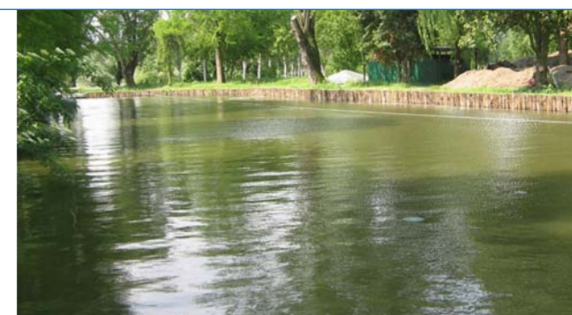
Darsena zona vela

Naturale conseguenza della riqualificazione della darsena e dello spostamento di numerose attività in corte Ungheria è la fornitura di acqua e di luce in quella zona.