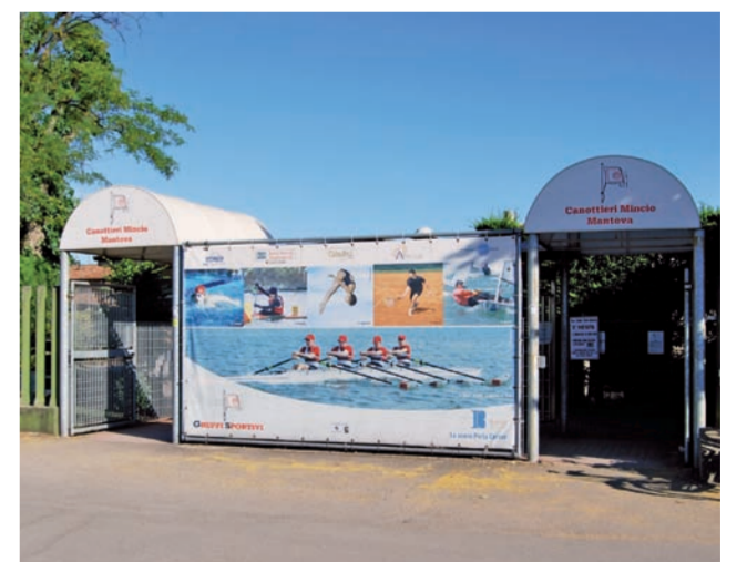
Telo n°1 all'ingresso della Società