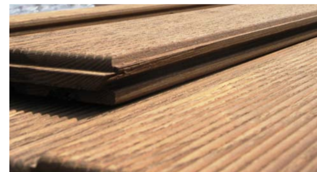
Rivestimento per la nuova terrazza