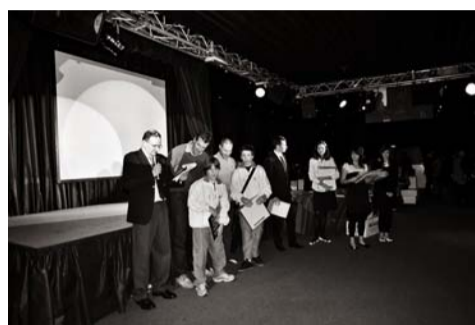
Un momento della premiazione