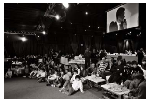
Il pubblico sazio di prelibatezze e sketch