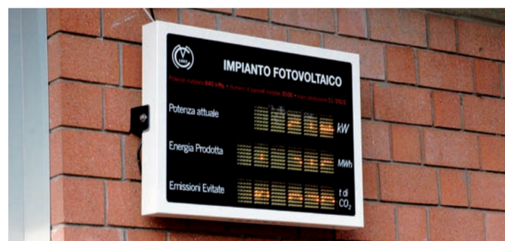
Tabellone luminoso all'ingresso del parcheggio