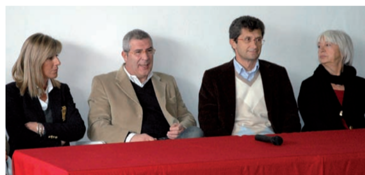
Il tavolo dei relatori alla conferenza stampa di dicembre per l'inaugurazione del fotovoltaico