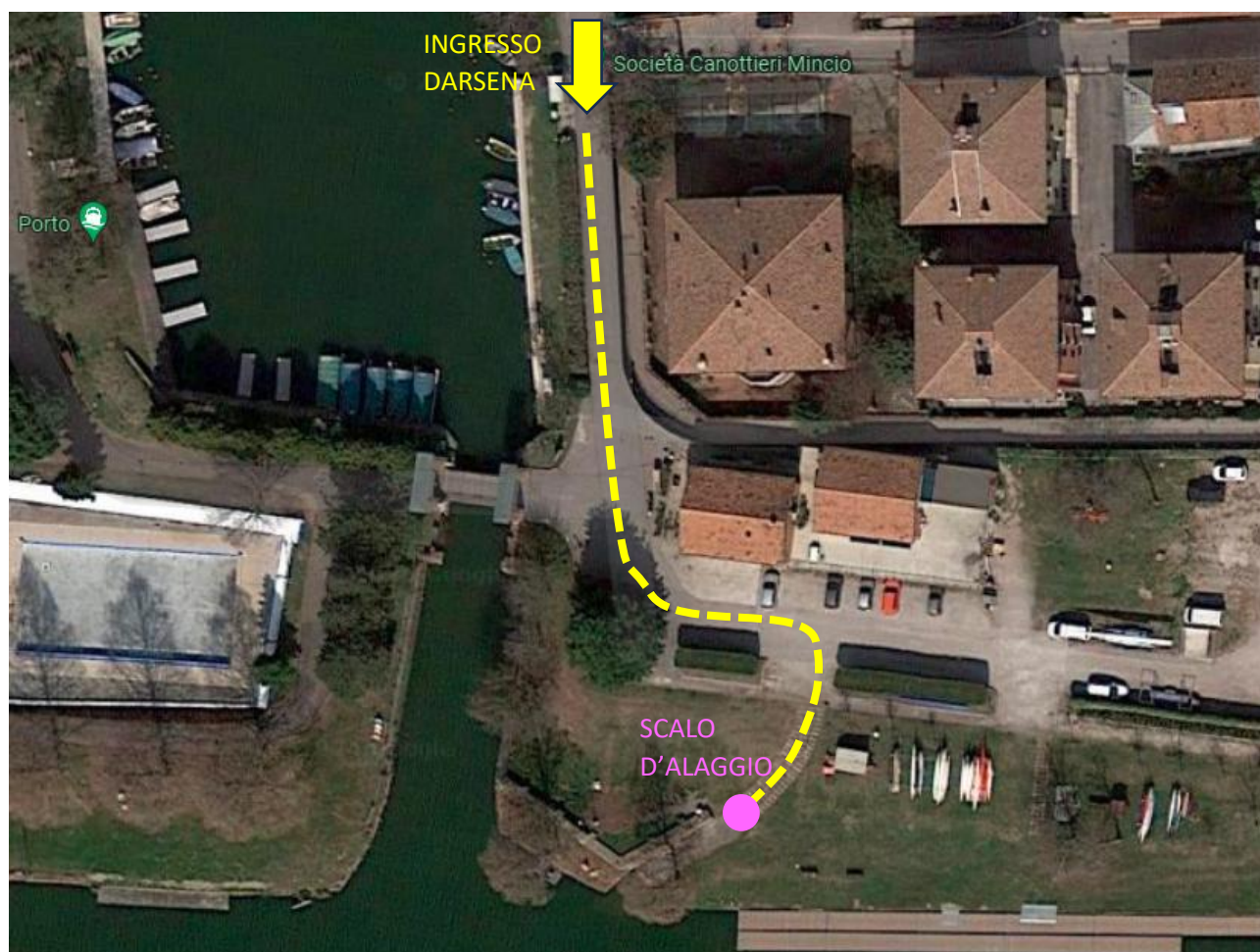
Percorso interno per varo / alaggio imbarcazioni lato Ingresso n. 1 Darsena Grande

In nessun caso bloccare vie d'accesso, uscite di emergenza, o attraversamenti pedonali.